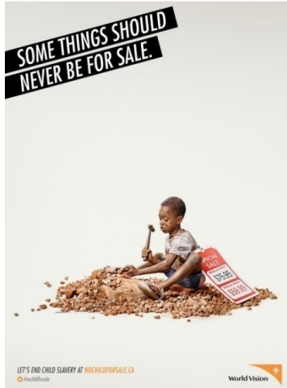
Resim 2. Dünya Vizyonu Kurumunun Kampanyası

Dünya Vizyonu (World Vision), insani yardım, kalkınma ve savunma kuruluşudur (WVI, 2019). Kampanya, 2013 yılında Kanada'da KBS+ reklam ajansı tarafından hazırlanmıştır. Kampanya dört temel görsel üzerinden yürütülmüştür. Dünya Vizyonu Kurumunun kampanyasında siyahı küçük bir çocuğun taş kırmakta olduğu gösterilmektedir. Kampanyada insan ticareti sonucu emek sömürsüne maruz kalan çocuklar konu edilmiştir. Küçük çocuğun taşları kırarken toz içinde olduğu aktarılmaktadır. Küçük çocuğun üzerinde büyük bir fiyat etiketi olduğu görülmektedir. Küçük çocuğun üzerinde yer alan etikette "Özel fiyat, 59, 99 dolar" yazmaktadır. Posterin üzerinde "Bazı şeyler asla satılmamalı" yazısı bulunmaktadır.