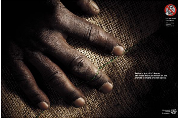
Resim 3. Uluslararası Çalışma Örgütü'nün Kampanyası

işçilerini bir araya getiren, çalışma standartlarını belirleyen, politikalar geliştiren ve tüm kadın ve erkekler için uygun işleri teşvik eden programlar tasarlayan bir organizasyondur (ILO, 2019). Kampanya, 2005 yılında Brezilya'da Almap BBDO reklam ajansı tarafından hazırlanmıştır. Kampanya üç temel görsel üzerinden yürütülmüştür. Kampanyada insan ticareti sonucu emek sömürsüne maruz kalan insanlar konu edilmiştir. Uluslararası Çalışma Örgütü'nün kampanyasında bir çuval bezinin üzerinde siyahi birinin eli olduğu görülmektedir. Posterde siyahi kişinin elinin üzerinden çuvalda yer alan dikiş ipinin geçtiği aktarılmaktadır. Posterde "Belki sen bilmiyordun ama dünyadaki işçilerden 20 milyonundan fazlası hala köledir" yazısı yer almaktadır.