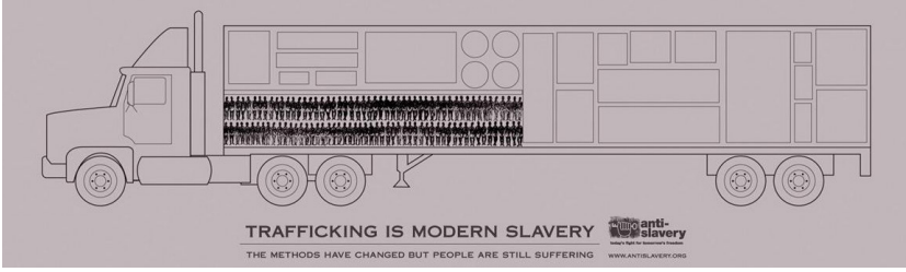
Resim 1. Kölelik Karşıtı Organizasyonunun Kampanyası