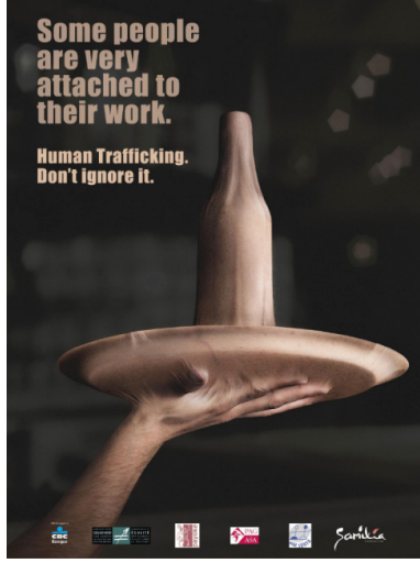
Resim 4. Samilia Vakfının Kampanyası