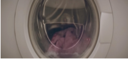
Sekans 2. 3.