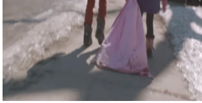
Sekans 2. 2.