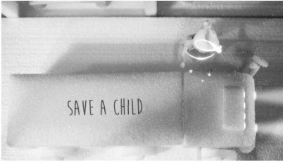
Sekans 1. 3.