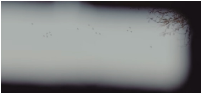
Sekans 3. 3.