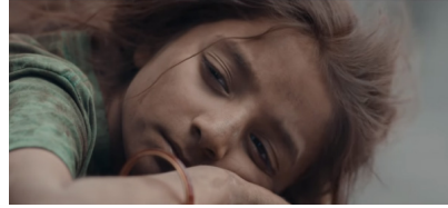
Sekans 3. 2.