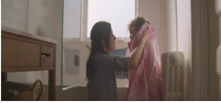
Sekans 2. 1.