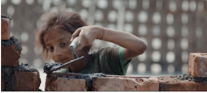
Sekans 3. 1.