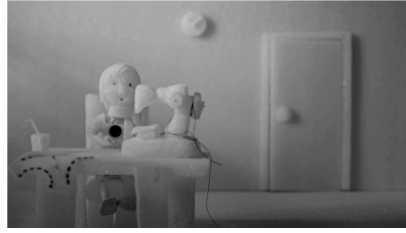
Sekans 1. 2.